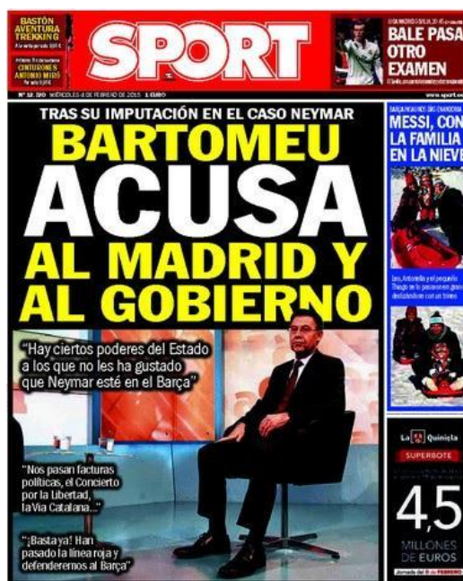
(9) Portada de Sport, 4/02/2015

Parece ser que la imputación no le ha sentado demasiado bien al presidente del F.C.B. Tal y como afirma el diario Sport en su portada, el dirigente catalán se plantea la posible influencia del Real Madrid y del gobierno español en su imputación: